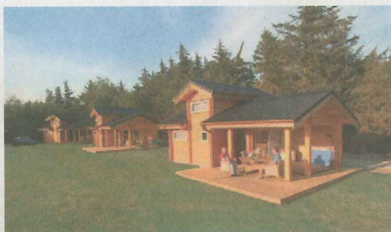
Har I ikke selv campingvogn, kan I leje en hytte på pladsen.