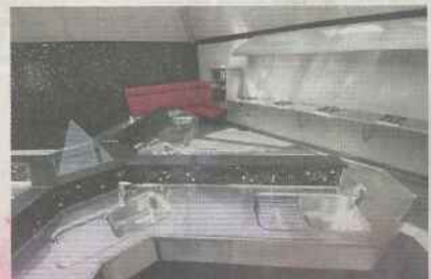
Jambo Feriepark er en stor virksomhed med en årlig omsætning på 15-20 mio. kr..