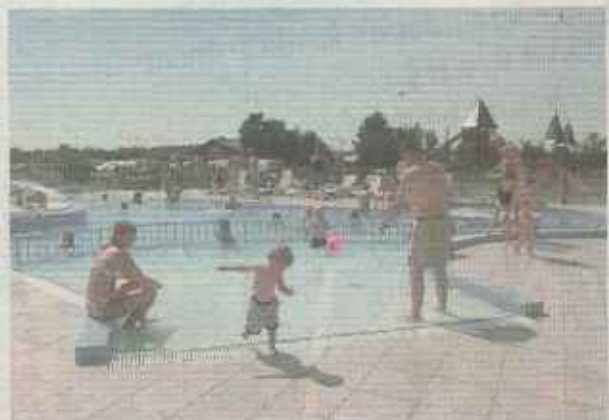
Børn har en meget stor stjerne i Jambo Feriepark.